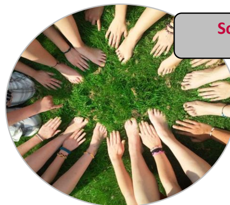
Sociální začleňování a zaměstnanost